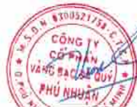
Tổng Giám Đốc